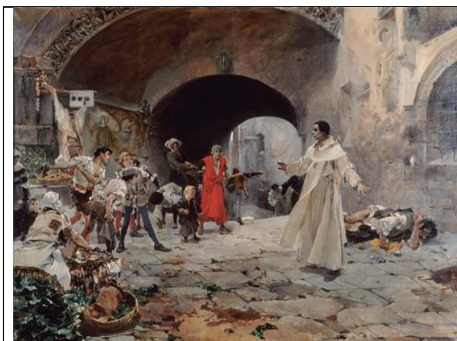
Figura 1: Título: El Padre Jofré protegiendo a un loco Autor: Joaquín Sorolla y Bastida, 1887 Técnica: Óleo sobre lienzo Ubicación: Museu Belles Artes. Valencia.

En la figura 1 el artista ilustró lo que ocurrió el 24 de febrero de 1409, cuando un fraile recriminó a un grupo de niños que se burlaban y golpeaban a un chico y le gritaban "¡Al loco!, mientras le daba amparo y lo llevaba al convento. Ese día, en el sermón de la Catedral habló de la necesidad de ayudar a quien sufre trastornos mentales, y evitar la "persecución irracional. Su proyecto fue realidad el 9 de marzo de 1.409 y es considerado el primer hospital psiquiátrico europeo, y en el que se inició la aplicación de métodos curativos para estos pacientes, así como el trato que el enfermo psiquiátrico se merece.