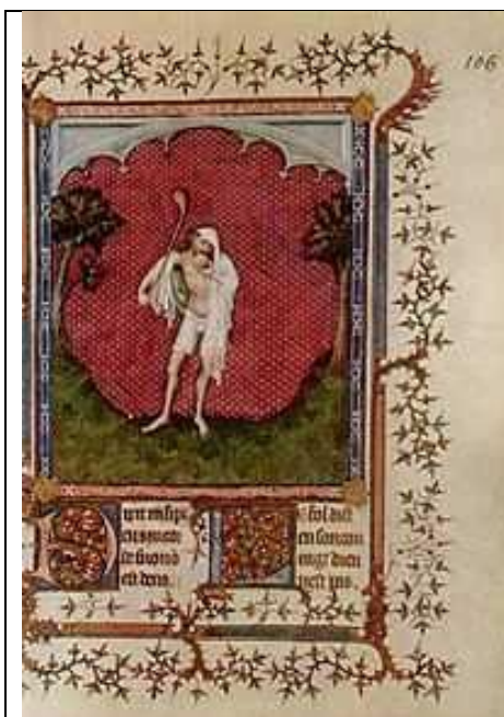
Figura 3: Titulo: Escena: Loco Autor: Jacquemart de Hesdin, h. 1386. Técnica: pergamino Localización: Biblioteca Nacional de Francia en París.

La obra sirve para reflexionar sobre el tema 1: la historia de la Psiquiatría basada en los aspectos de concepción de la enfermedad y salud mental, teniendo en cuenta el momento histórico social. En la figura 3 obsérvese que el artista representó un individuo con aspecto descuidado y harapiento que intenta comerse una bola de madera de un juego de criquet, expresión de desmotivación, apatía, preámbulo de depresión. La obra sirve para reflexionar sobre el tema 2: los trastornos sensorio perceptivos: desrealización y despersonalización, y revelar la importancia del método clínico para la búsqueda de información mediante el examen físico: actitud.