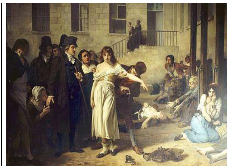
Figura 4: Título de la obra: Pinel a los locos en Salpêtrière Autor: Tony Robert Fleury, 1795

La obra posibilita una reflexión sobre la ética médica en la atención al paciente con enfermedad psiquiátrica: obsérvese la actitud de la sociedad que apoya la liberación de la paciente y como la mujer ilustrada a la izquierda besa la mano de líder que dirige esta decisión. También es útil para el estudio del tema 8.- Psicosis, y revelar la importancia del método clínico para la búsqueda de información mediante el examen físico: actitud y facie del paciente; obsérvese en el centro de la obra, la mujer con una actitud indiferente, distraída.