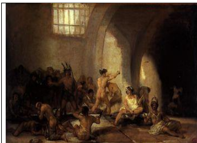
Figura 2: Título: Casa de locos, o Manicomio” Estilo: Romanticismo Autor: Francisco de Goya, 1812-1819 Técnica: Óleo sobre tabla- Localización: Real Academia de Bellas Artes de San Fernando, Madrid, España

La obra sirve para reflexionar sobre el tema 1: la historia de la Psiquiatría basada en los aspectos de concepción de la enfermedad y salud mental, teniendo en cuenta el momento histórico social. En la figura 3 obsérvese que el artista representó un individuo con aspecto descuidado y harapiento que intenta comerse una bola de madera de un juego de criquet, expresión de desmotivación, apatía, preámbulo de depresión. La obra sirve para reflexionar sobre el tema 2: los trastornos sensorio perceptivos: desrealización y despersonalización, y revelar la importancia del método clínico para la búsqueda de información mediante el examen físico: actitud.