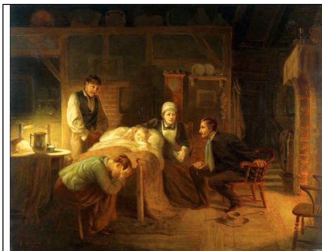
Pintura 3: Título de la obra: Anxious moments: a sick child, its grieving parents, a nursemaid and a medical practitioner

La obra sirve para expresar la utilidad del método clínico para la búsqueda de información mediante el examen físico: actitud del paciente, y reflexionar sobre las funciones afectivas: Trastornos de la esfera afectiva, ansiedad