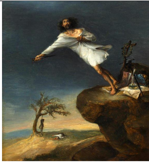
Pintura 4: Título: Sátira del suicidio romántico Autor: Leonardo Alenza y Nieto. 1839 Técnica: Óleo sobre lienzo Localización: Museo Romántico.

La obra sirve para expresar la utilidad del método clínico para la búsqueda de información mediante el examen físico: actitud y facie del paciente, y para reflexionar sobre el tema 2 (Semiología psiquiátrica: Trastornos del pensamiento: en su contenido: ideas suicidas) y el tema 9 (Concepto y factores de riesgo de suicidio, intento suicida e ideación suicida. Evaluación del paciente con conducta suicida. Elementos básicos del Programa de prevención y control de la conducta suicida. Conducta a seguir ante intento suicida o del paciente con potencial suicida).